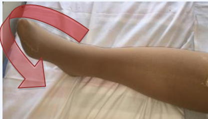
Mouvements circulaires de la cheville (permet la circulation sanguine)